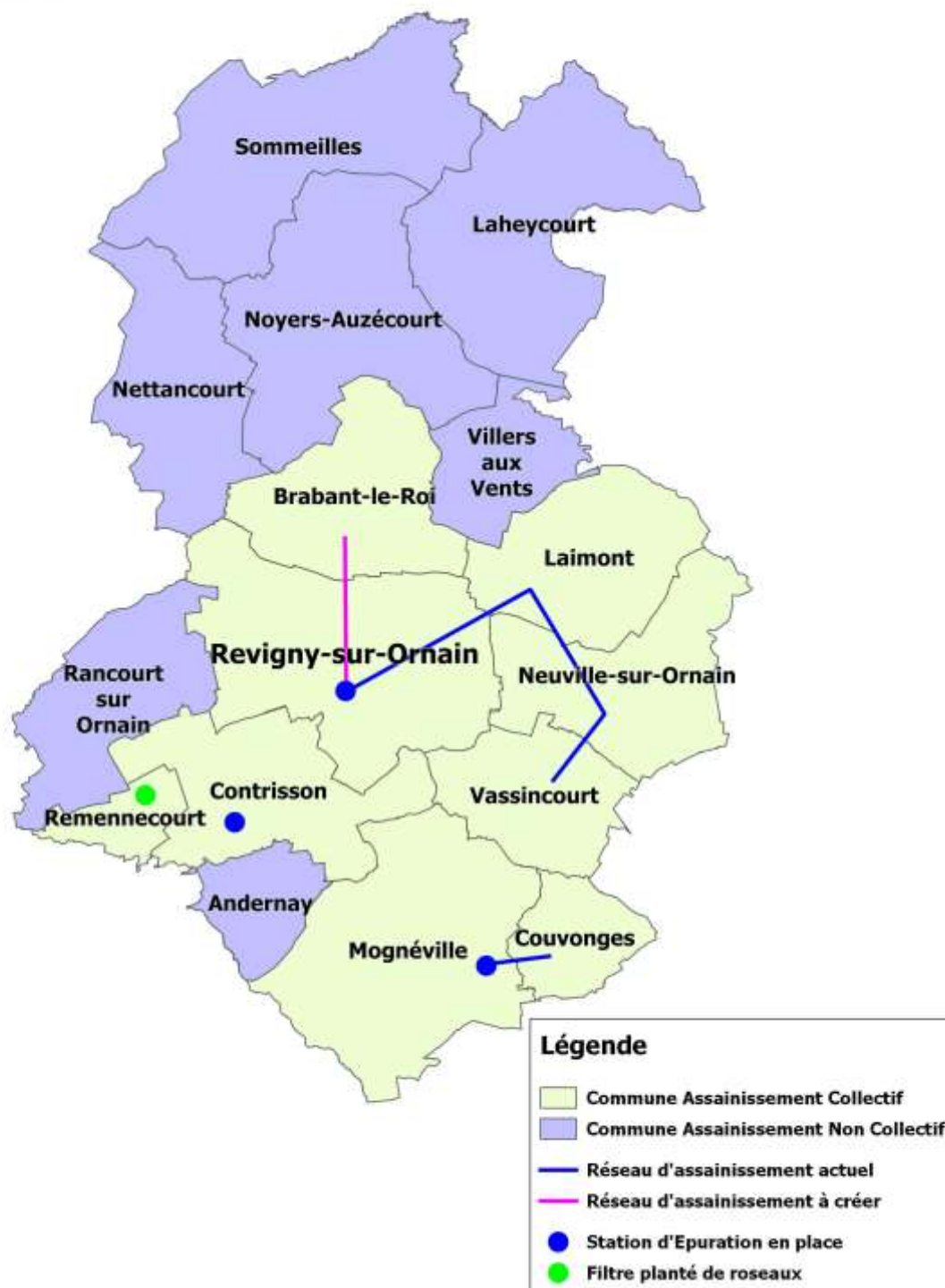
Figure 1 : L'assainissement dans les communes du territoire